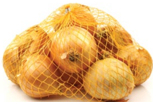
■ Mala pakovanja (1 kg) - PRAVILNO PAKOVANJE ZA KLASU I