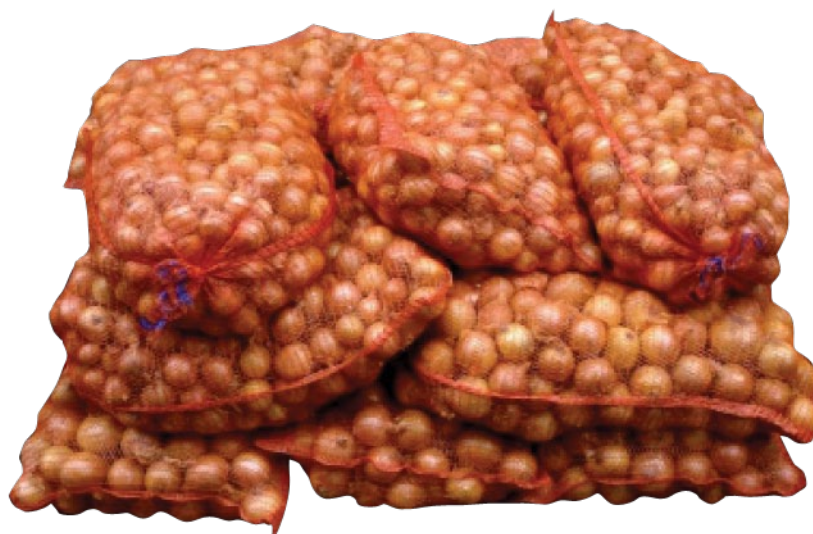
■ Velika pakovanja - PRAVILNO PAKOVANJE ZA KLASU I & II